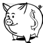
私校退撫儲金(新制)-自主投資 111年度1月~9月期間報酬率

3. 資料來源：財團法人中華民國私立學校教職員退休撫卹離職資遣儲金管理委員會網站公告資料。